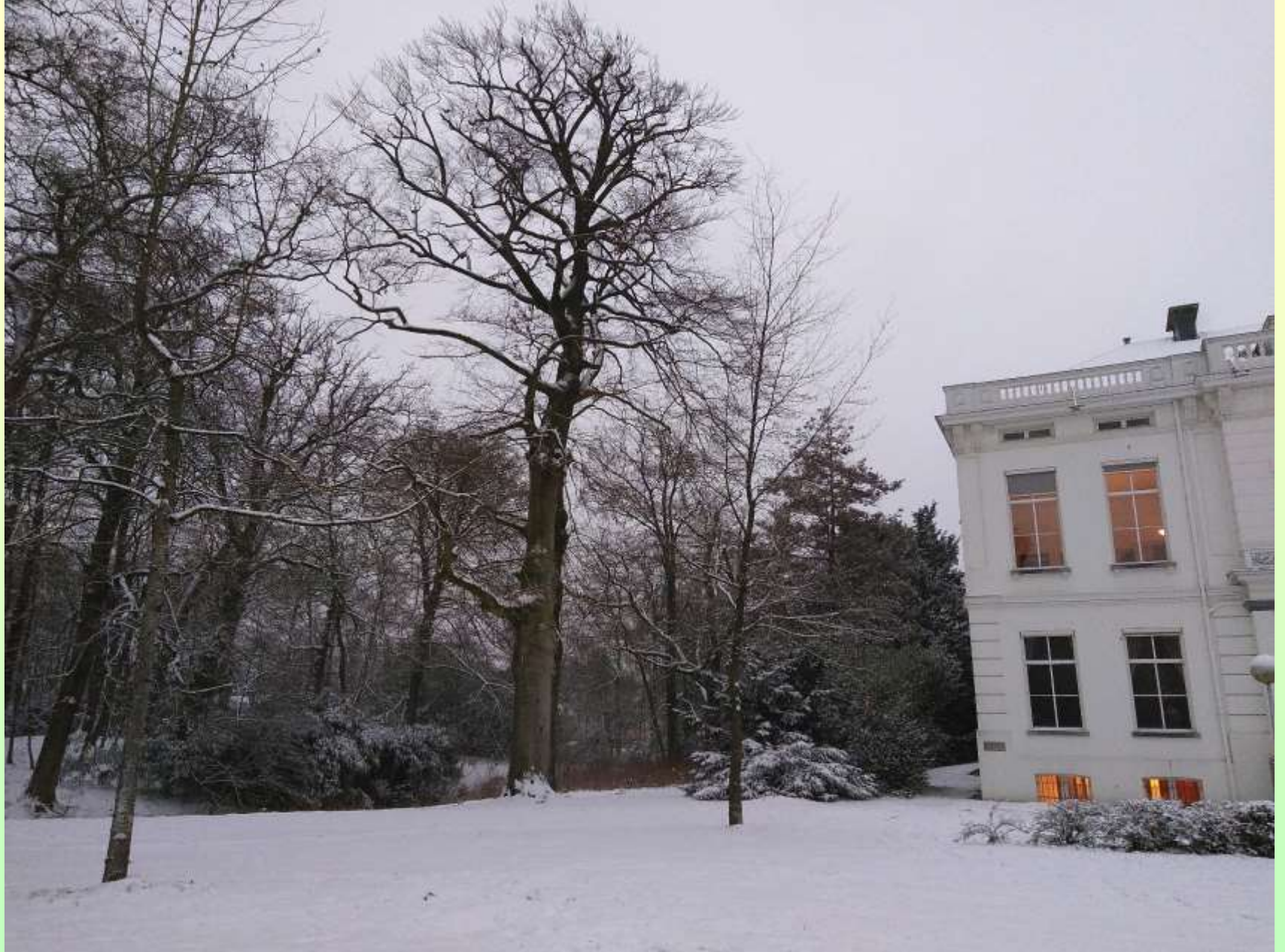
Oudste beuk naast het huis