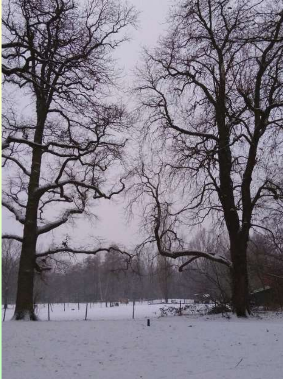
Kastanje en eik langs de oprijlaan met doorzicht naar weiland