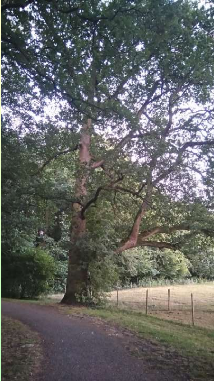
Oudste eik naast oprijlaan zomerbeeld