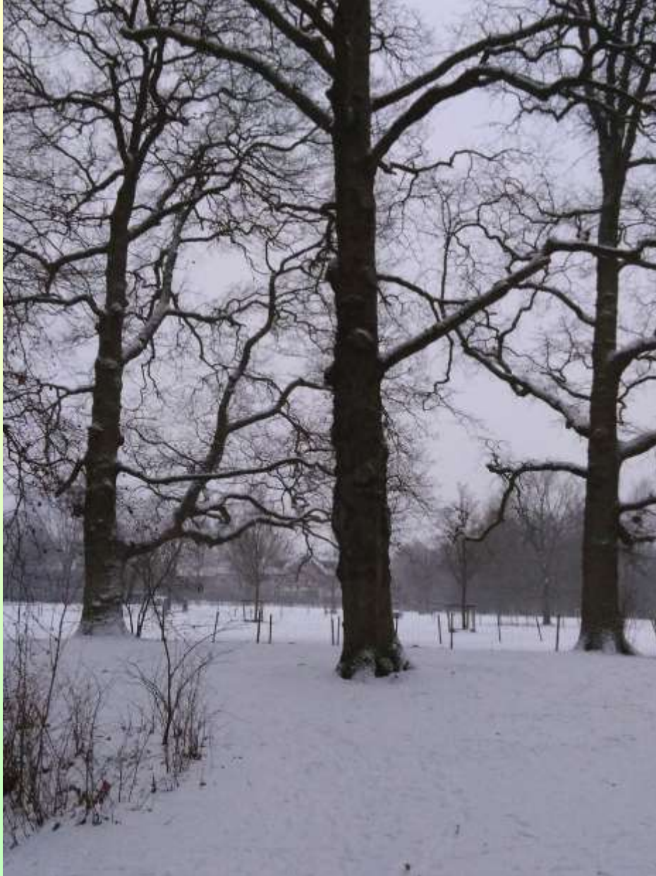
Oude kastanje en eiken met doorzicht naar het weiland van Boerderij De Brink