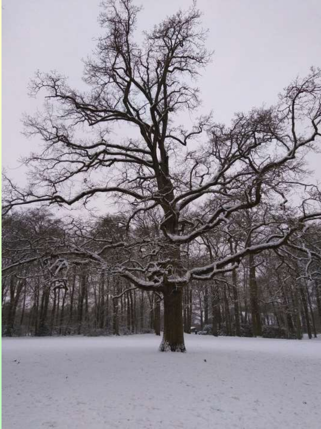
De solitaire eik in het gazon achterzijde