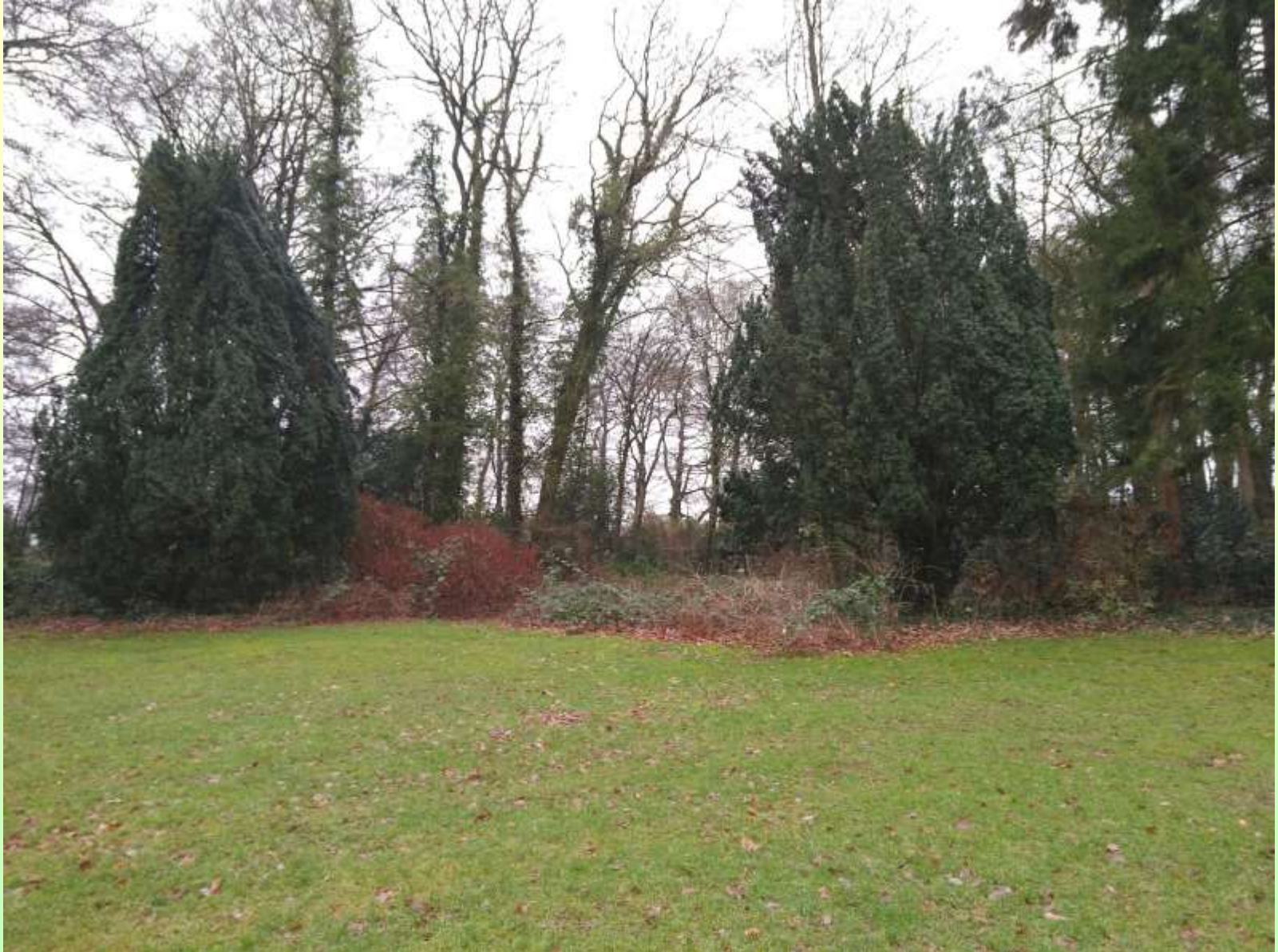
Twee zuiltaxussen: herinnering aan het formele element uit tuinkaart 1922