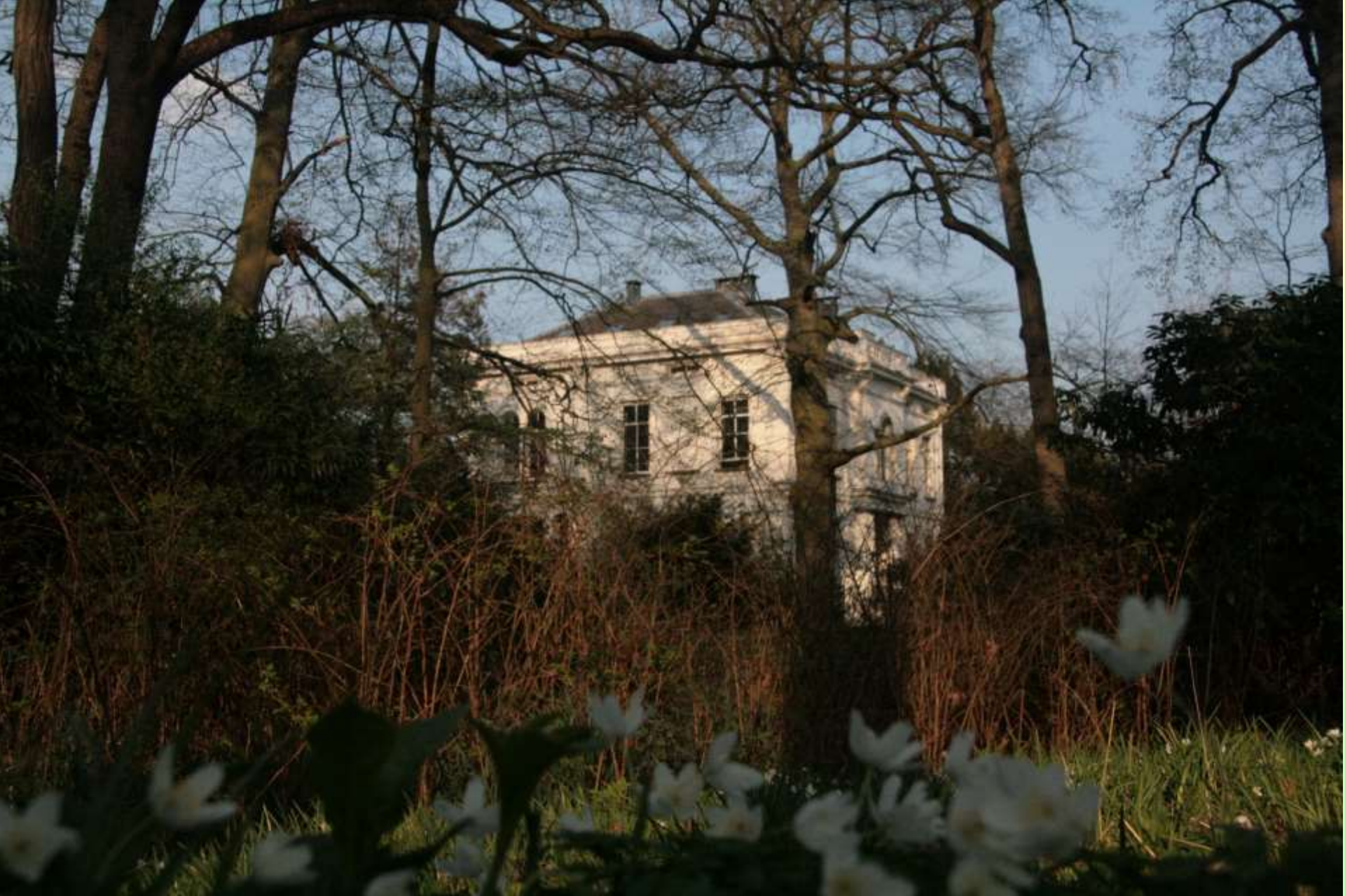
Bosanemonen in het voorjaar