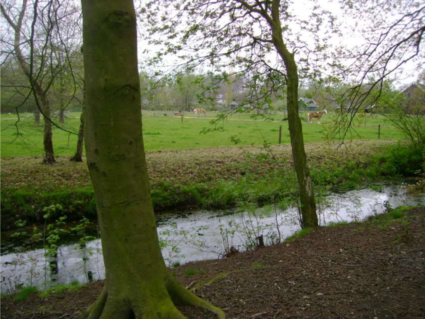
Vak 1. Vanaf het wandelpad door het bos, zicht op de weiland en de boerderij.