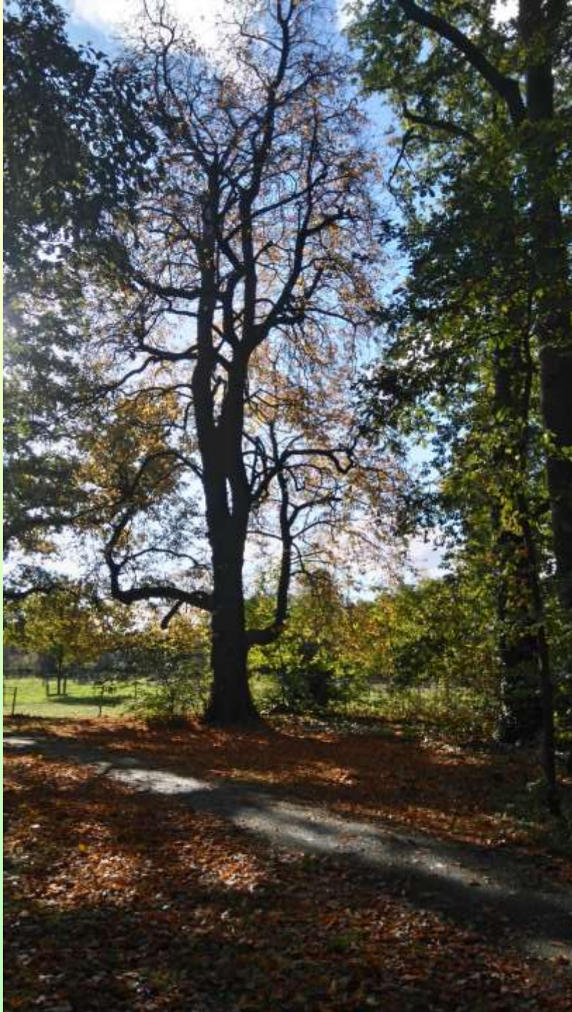
De oude kastanje