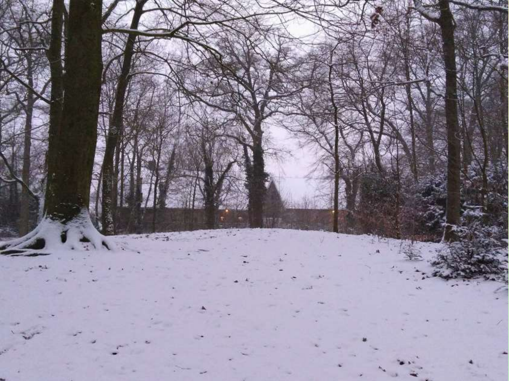
Winterbeeld: doorzicht vanuit het park op Boerderij de Brink