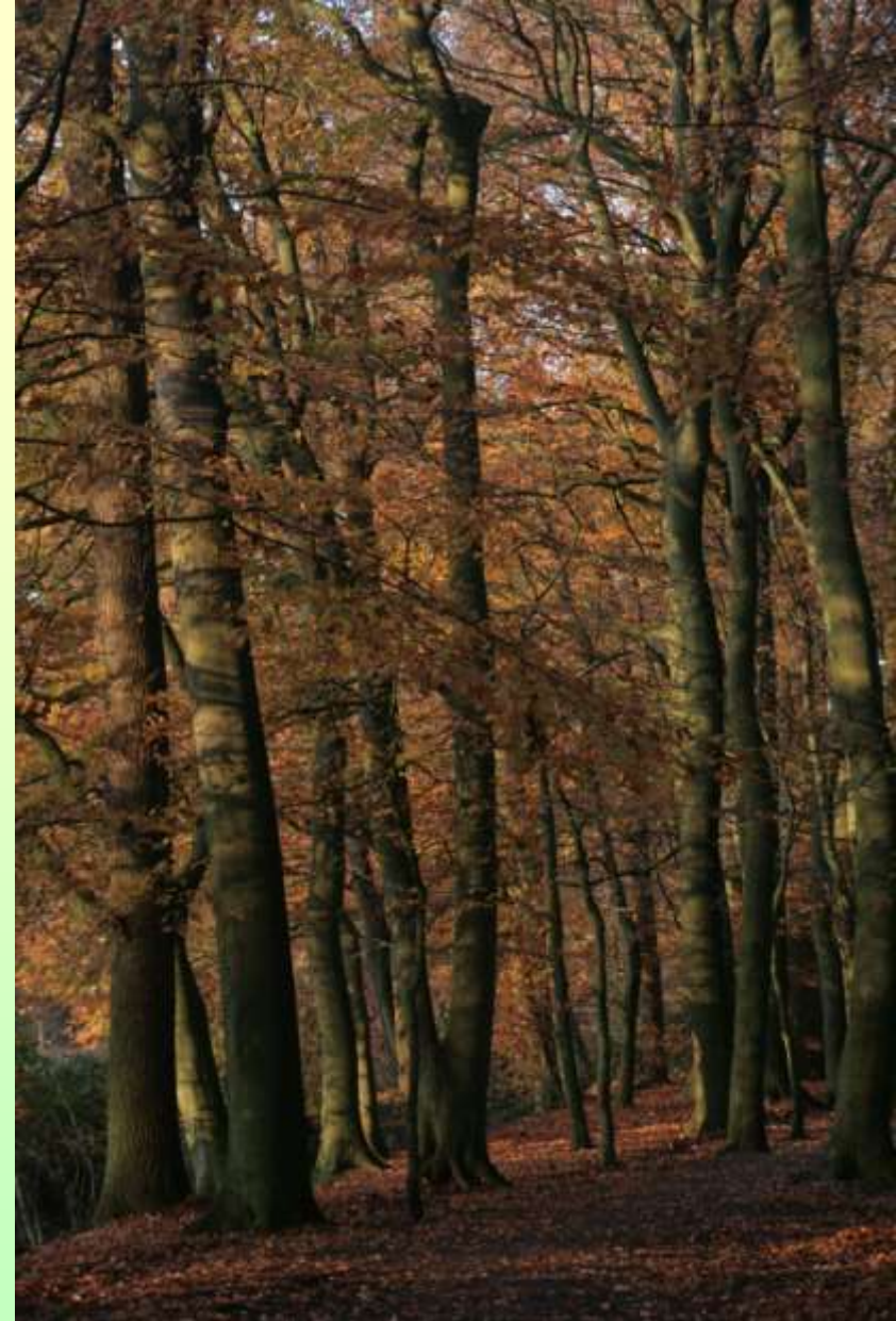
Vak 1 Wandelen door het landgoed en natuurbos van beuk en eik.