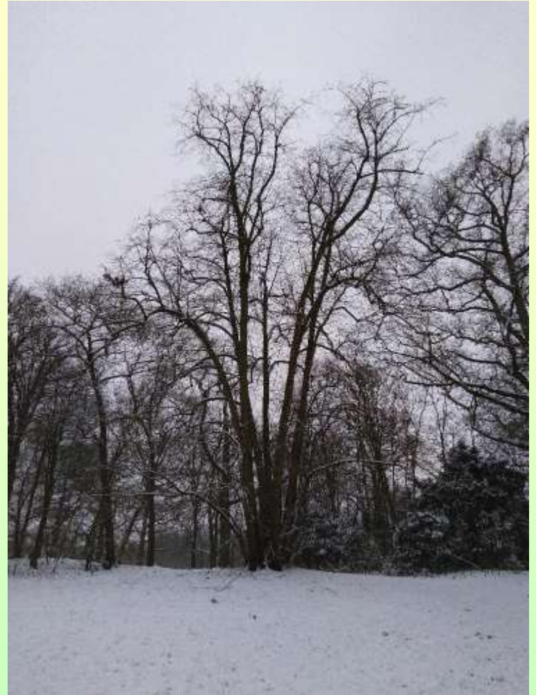
De meerstammige linde op een heuveltje