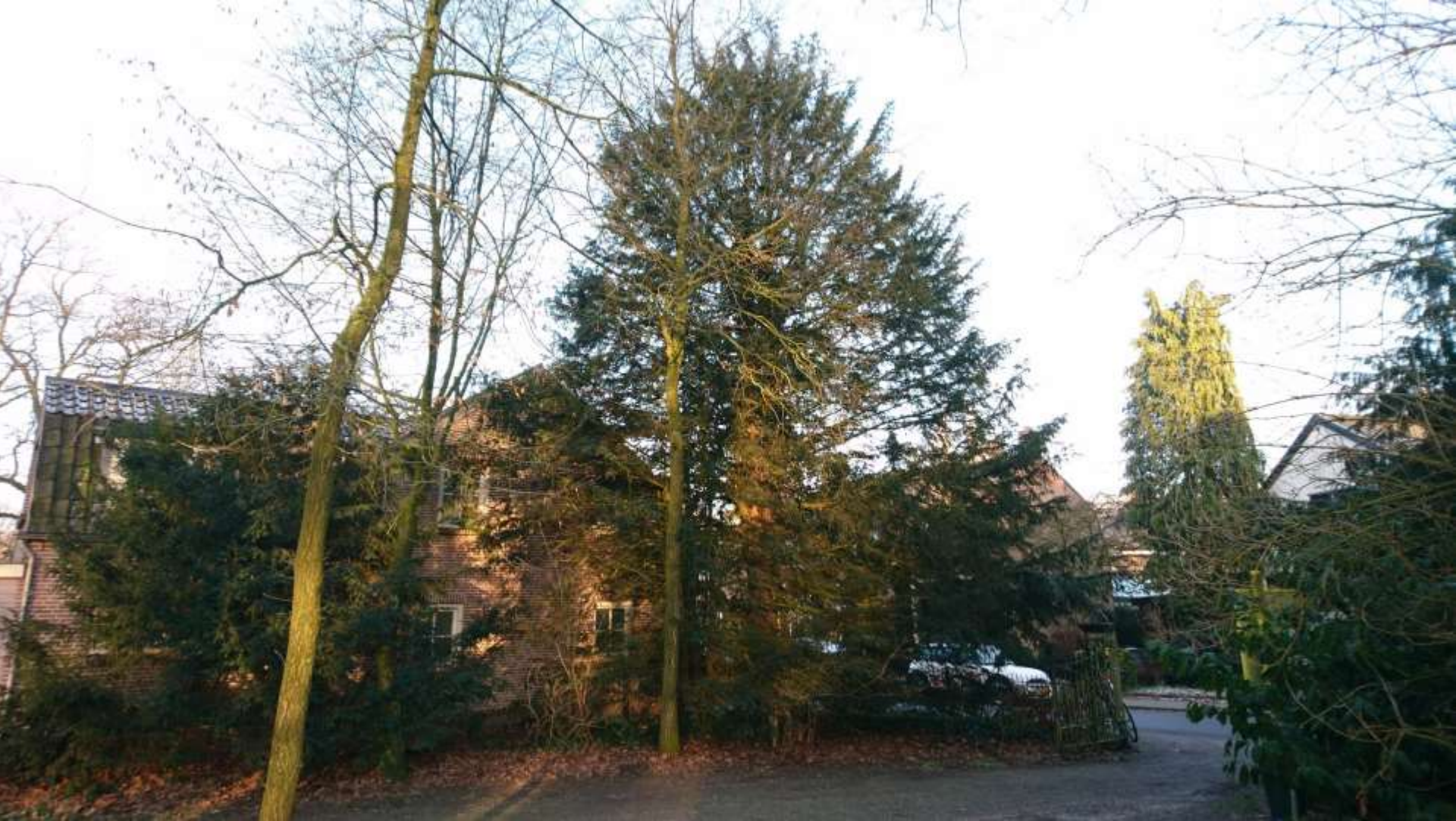
Groenblijvende taxusboom bij de ingang Kroostweg.