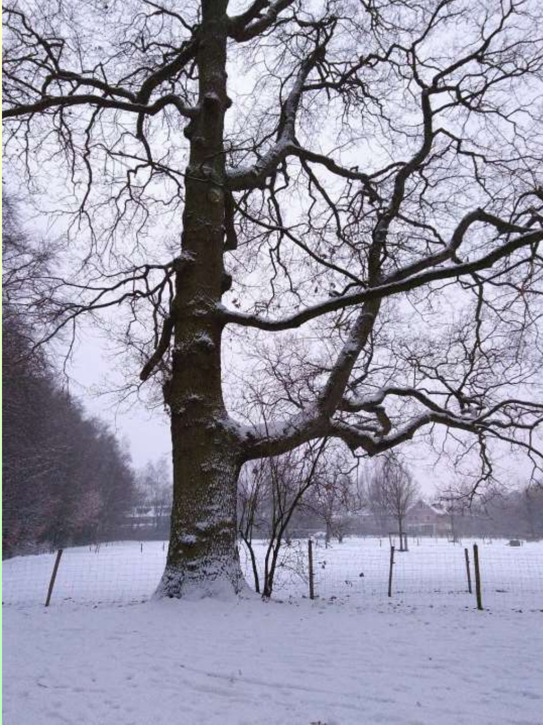
Oudste eik winterbeeld