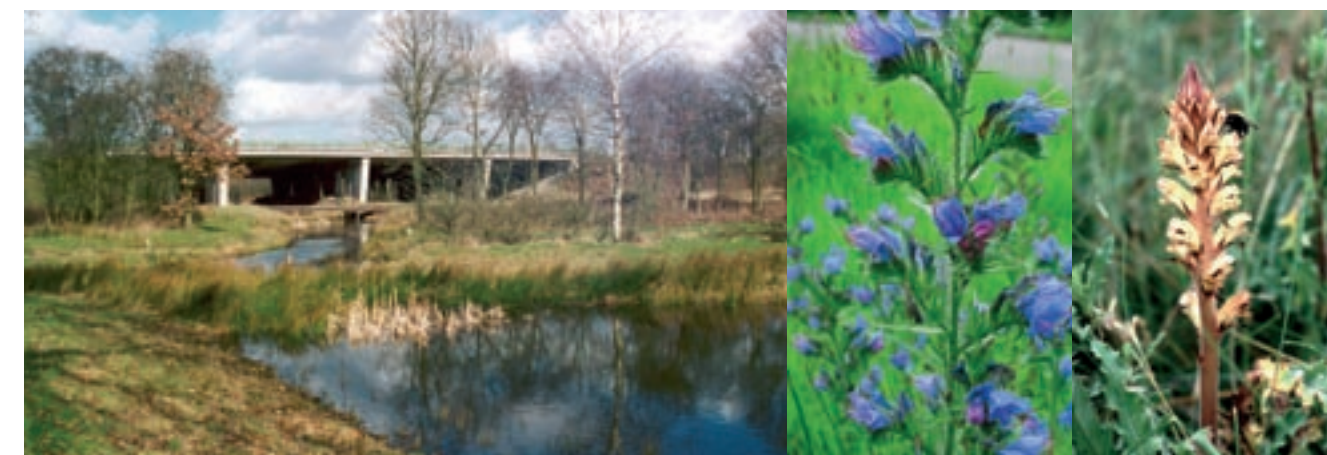
Wildviaduct onder de A28 bij Oostbroek

De ligging midden in een stedelijke omgeving maakt het gebied erg kwetsbaar. De dieren ontmoeten talloze barrières op hun trekroutes: de A28, de N225, de spoorlijn Utrecht-Arnhem, de A12 en verder ook vele hekwerken. Dieren kunnen daardoor niet meer van de ene naar de andere plek komen en raken zo geïsoleerd. Het verwijderen van hekwerken en de aanleg