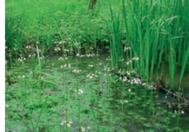
Waterviolier in het kwelgebied van Blikkenburg

Bijzonder is ook de aanwezigheid van schoon kwelwater. Dat is regenwater dat lang geleden is weggezaakt in de bodem van de Heuvelrug, door het zand wordt gefilterd en dan weer bovenkomt in het Kromme Rijngebied. Een proces dat con-